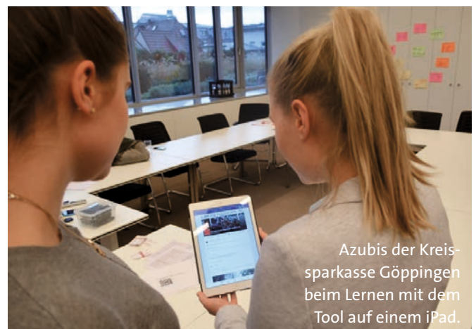
Azubis der Kreissparkasse Göppingen beim Lernen mit dem Tool auf einem iPad.

buch. Aber das heißt nicht zwangsläufig, dass die Jugendlichen nichts mehr lernen, sondern sie integrieren digitales Verhalten ins Lernen.